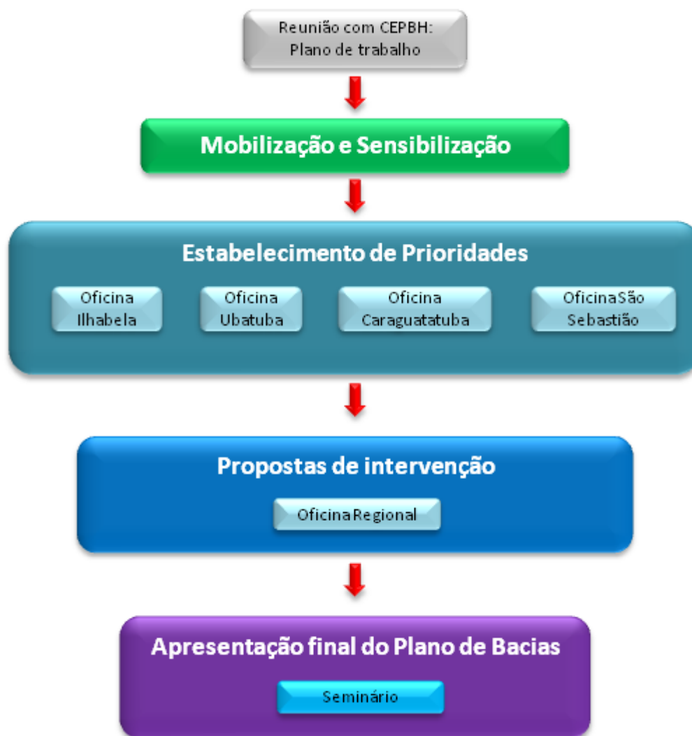
Figura 1 - Fluxo de trabalho para mobilização social e oficinas participativas para a construção do Plano de Bacias da UGRHI 3.

Descrição: realizar ao longo de todo o projeto a cobertura fotojornalística e vídeoreportagem para produção e veiculação de vídeos nas páginas da internet vinculadas ao CBH-LN e outras. A cobertura jornalística deverá ser feita em mídia escrita, áudio e vídeo, produção de releases, boletins informativos e vídeoreportagem (tempo estimado 12 meses).